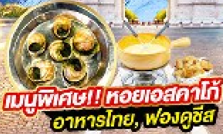
เมนูพิเศษ! หอยเอสคาโก้ อาหารไทย, ฟองดูซีส