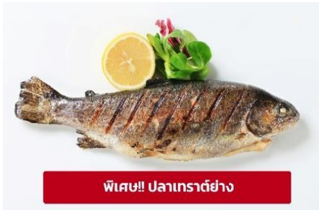
พิเศษ!! ปลาเทราต์ย่าง

เกียง ๑๑ รับประทานอาหารเที่ยง (มื้อที่3) เมนูพิเศษ ปลาเทราต์ย่างท่านละ 1 ตัว นำท่านเดินทางสู่ เมืองลินซ์ (Linz) (ระยะทาง 125 กม./ 2 ชม.) เป็นเมืองที่มีการผลิตเหล็ก เครื่องจักร อุปกรณ์ไฟฟ้า อดีตเป็นศูนย์กลางการค้าที่สำคัญ ให้ท่านถ่ายรูปบริเวณด้านนอก พิพิธภัณฑ์แห่งโลกอนาคต (Ars Electronica Center) ตั้งอยู่ริมแม่น้ำดานูบ เป็นที่จัดแสดงวิทยาการต่างๆ ที่ส่งผลต่อมวลมนุษยชาติปัจจุบัน ไม่ว่าจะเป็นอวกาศ หุ่นยนต์และเอไอ ยารักษาโรค เป็นต้น