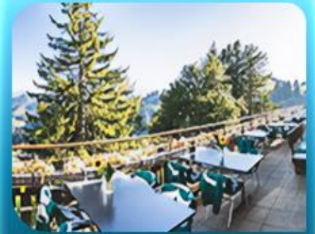
บทยอดเขาริกิ