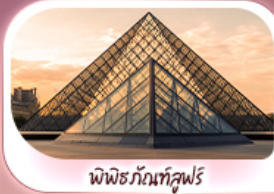
พีพิดกับที่ลูฟวร์