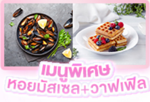
เมนูพิเศษ หอยมัสเซล+วาฟเฟิล