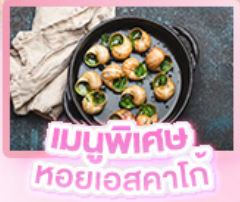
เมนูพิเศษ หอยเอสคาโท

เยอรมัน เนเธอร์แลนด์ เบลเยียม ฝรั่งเศส Keukenhof