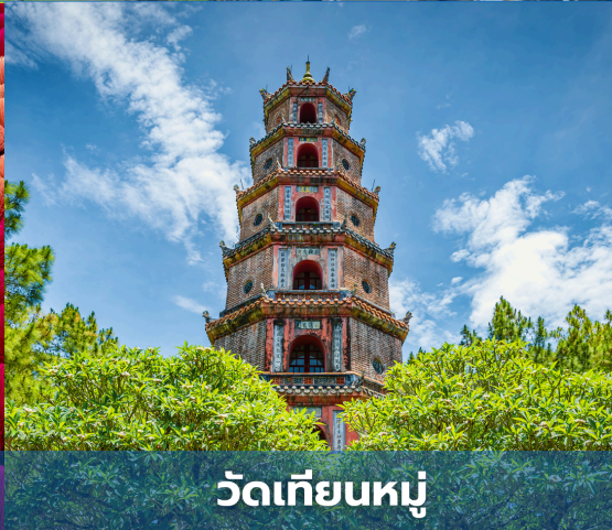
วัดเทียนมู่