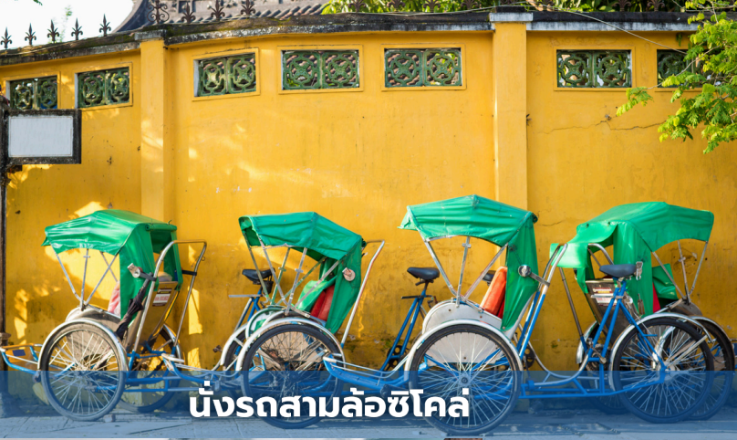
นั่งรถสามล้อซิโคล