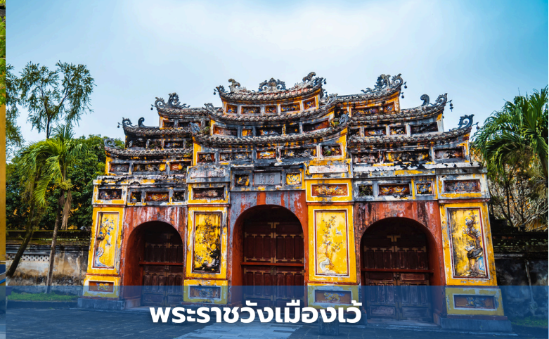
พระราชวังเมืองเว้