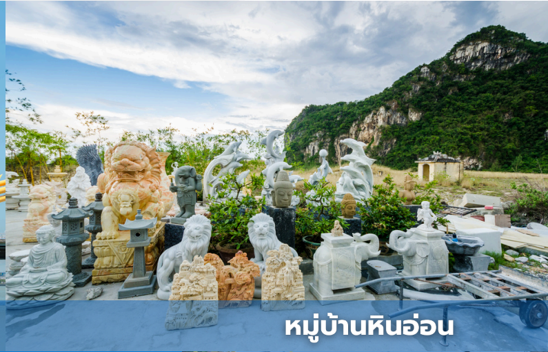
หมู่บ้านหินอ่อน