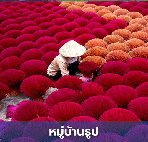
หมู่บ้านรูป