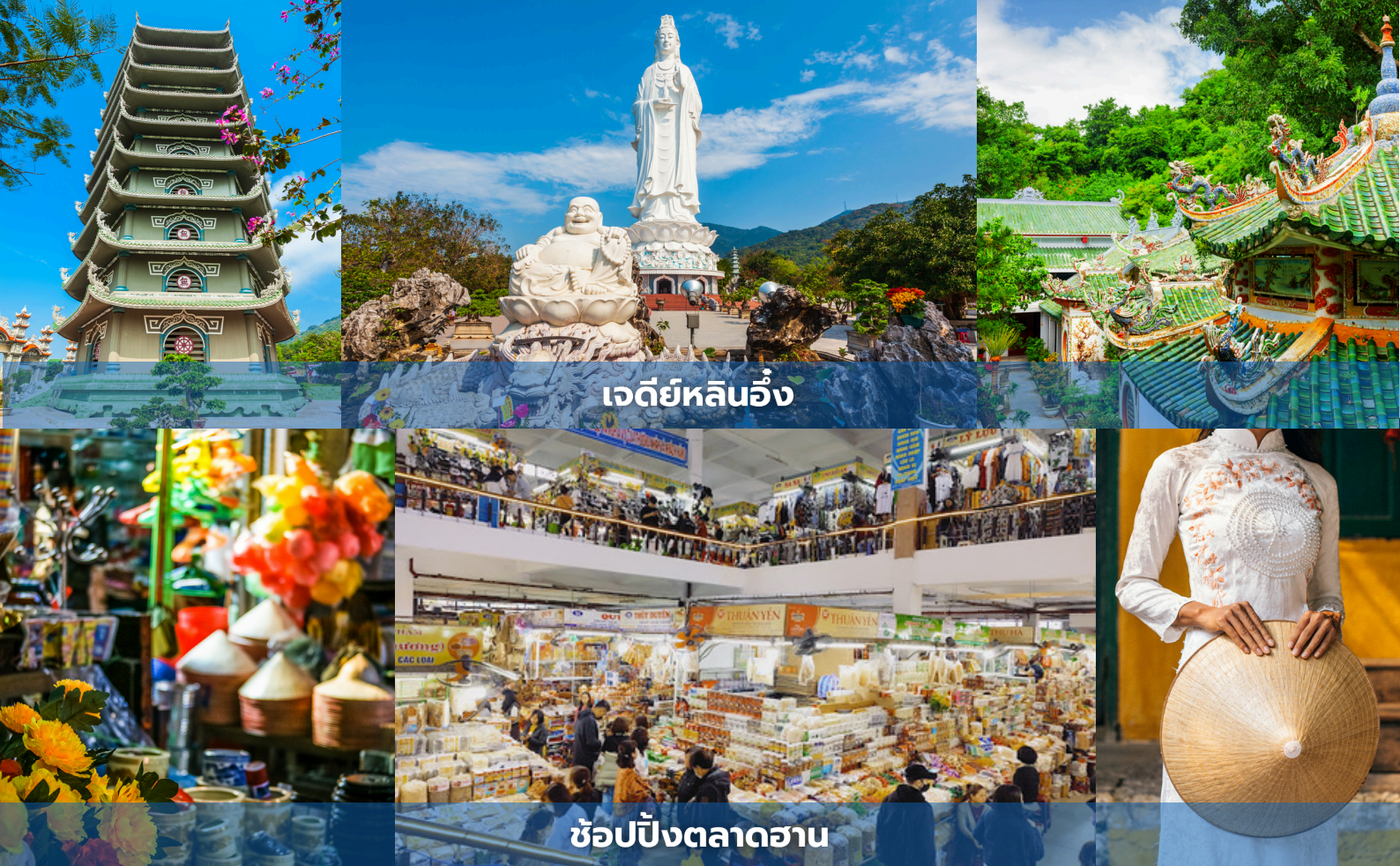
เจดีย์หลินอึ้ง