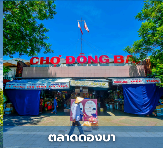
ตลาดดองบา

สำหรับเที่ยวบินที่แนะนำ : AIRASIA FD636 (DMK-DAD 10:30-12:10)