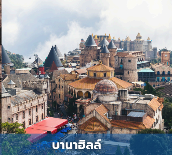
บานาฮิลล์