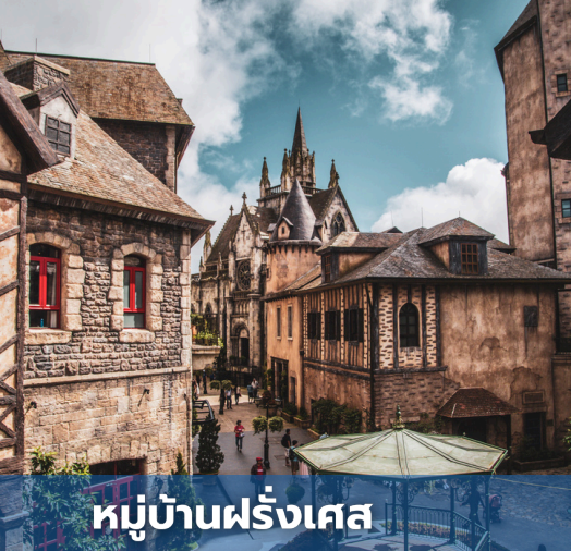
หมู่บ้านฝรั่งเศส