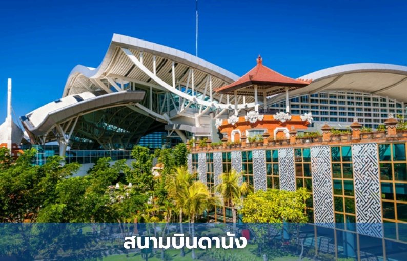
สนามบินดานัง