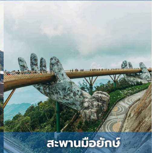
สะพานมือยักษ์