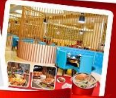
ก๊วยแม่ น้ำ + HOTPOT SEAFOOD