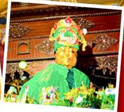
ขอพรแม่ยักษ์