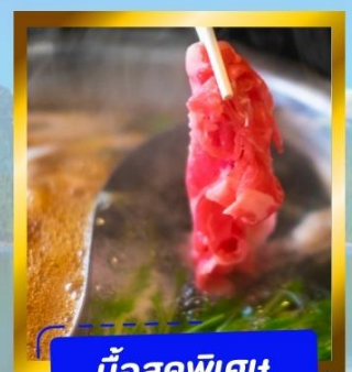
มือสุดพิเศษ