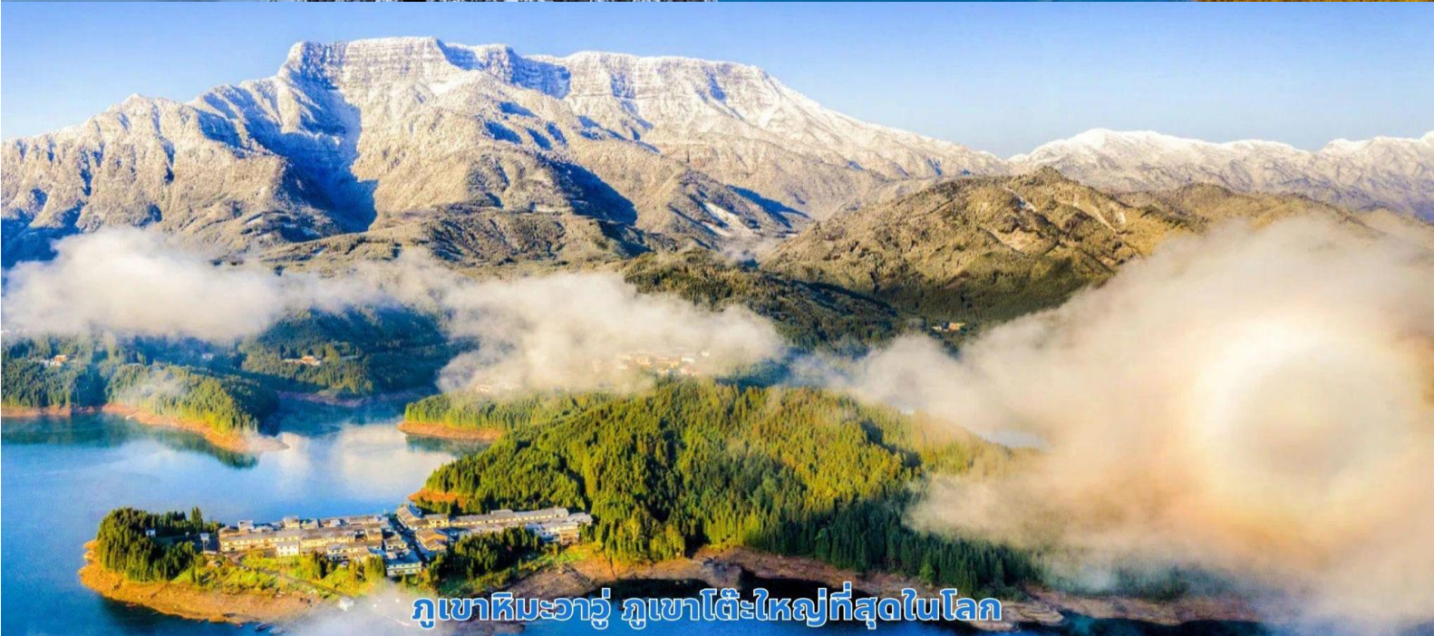
ภูเขาหิมะวาวู ภูเขาโต๊ะใหญ่ที่สุดในโลก