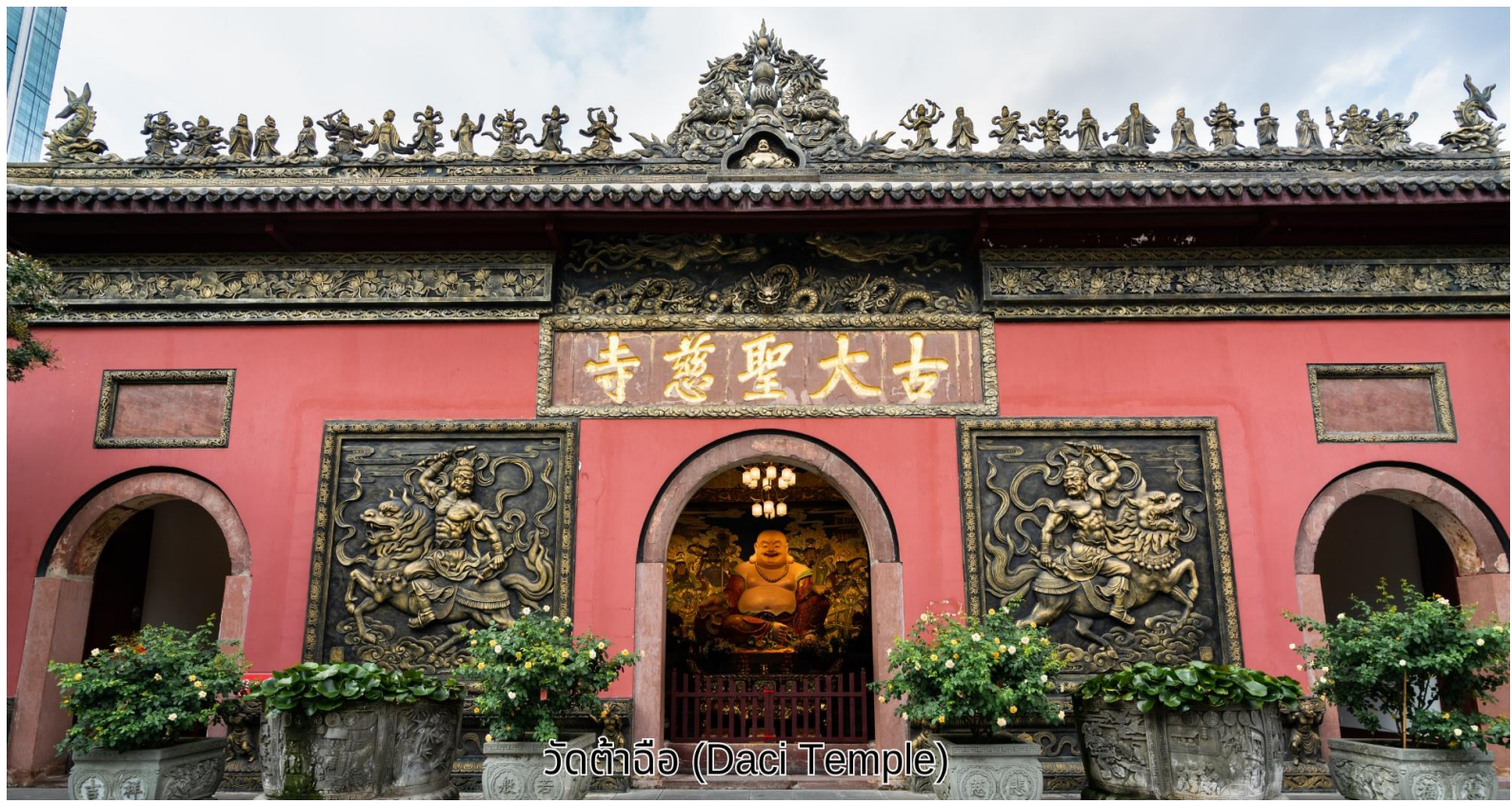
วัดต้าจื่อ (Daci Temple)

เช้า บริการอาหารเช้า ณ ห้องอาหารของโรงแรม จากนั้นเดินทางไปยัง วัดต้าจื่อ เป็นวัดเก่าแก่ที่มีอายุยาวนานกว่า 1,600 ปี ตั้งอยู่ใจกลางของ Chengdu ที่นี่ถือเป็นสถานที่สำคัญที่น่าสนใจ เพราะเป็นวัดที่พระถังซำจั๋งบวชเป็นพระภิกษุก่อนจะย้ายไปจำพรรษายังวัดอื่นภายในวัดต้าจื่ออันเงียบสงบ จากนั้นนำท่านเข้าเยี่ยมชม ศูนย์ผลิตภัณฑ์ยาจีนและบัวหิมะ ฟังการบรรยายผลิตภัณฑ์ยาจีนและสรรพคุณบัวหิมะ หรือ เป่าฟู่หลิง ที่รักษาอาการอักเสบของผิวหนัง แก้แผลพุพอง ไฟไหม้ น้ำร้อนลวก ผื่นแพ้คัน จากนั้นนำท่านเข้าเยี่ยมชม ศูนย์ผลิตภัณฑ์อัญมณีหยก หยกนับเครื่องประดับที่นิยมกันอย่างแพร่หลายตามความเชื่อของคนชาวจีนซึ่งมีมาตั้งแต่สมัยโบราณโดยเฉพาะความเชื่อเกี่ยวกับการใส่หยกเป็นเครื่องประดับจะช่วยเสริมให้มีอำนาจ ช่วยให้มีความสำเร็จก้าวหน้าและความเจริญรุ่งเรือง อีกทั้งยังช่วยสร้างสมดุลให้เกิดขึ้นได้ทั้งร่างกายและจิตใจ รวมไปถึงการช่วยเสริมพลังให้ร่างกายแข็งแรง