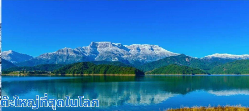
ภูเขาหิมะวาวู ภูเขาโต๊ะใหญ่ที่สุดในโลก