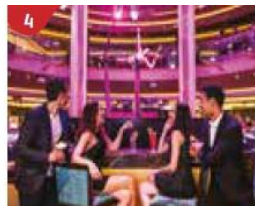
4 Bar 360 Catch live music and aerial acrobatic performances with a glass of champagne.