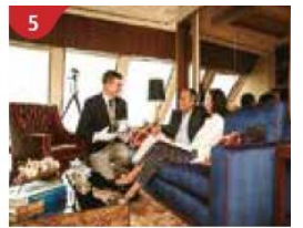
5 The Palace Indulge in European-style butler service and exclusive facilities.