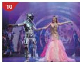
10 Zodiac Theatre Enjoy live production shows from the acclaimed award-winning entertainment team.