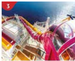
3 Waterslide Park Get drenched in fun on one of our six different waterslides.