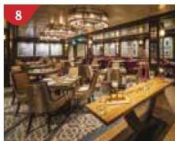
8 Bistro By Mark Best Relish contemporary Western cuisine from the internationally-acclaimed Australian chef.