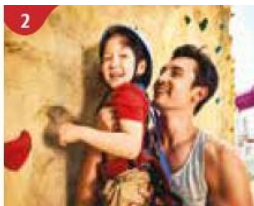
2 Rock Climbing Wall Challenge yourself on our mountainous rock climbing wall.