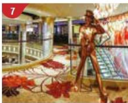
7 Johnnie Walker House™ Immerse yourself in the intricate world of premium Scotch whisky.