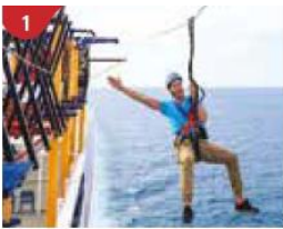
1 Ropes Course & Zipline Feel the thrill of gliding above the ocean on a 35-metre zipline.