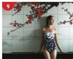
9 Crystal Life™ Spa Rejuvenate mind, body and soul with our holistic Western and Asian spa experience.