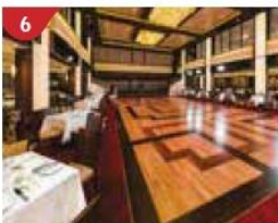
6 Dream Dining Room Savour a wide variety of Asian and international cuisine.