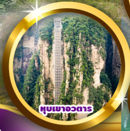
หุบเขาวตาร