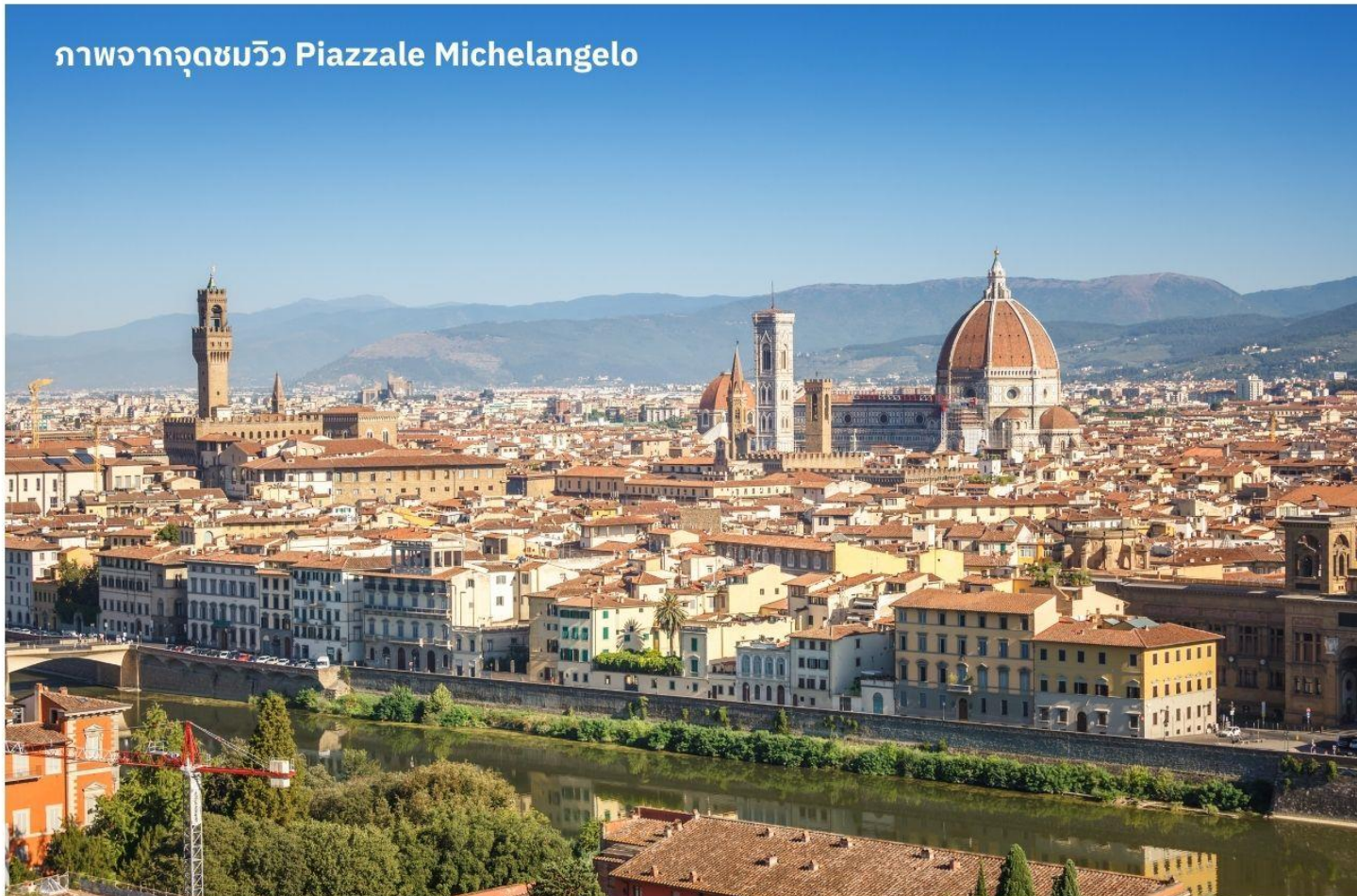
ภาพจากจุดชมวิวก Piazzale Michelangelo

เมืองฟลอเรนซ์ ตั้งอยู่ทางตอนเหนือของประเทศอิตาลี เป็นเมืองที่มีชื่อเสียงในช่วงศตวรรษที่ 13-14 ซึ่งเป็นยุคที่เจริญรุ่งเรืองของวัฒนธรรมและศิลปะ อีกทั้งในอดีตยังมีความสำคัญทางการค้าและวัฒนธรรม มีสถาปัตยกรรมที่งดงามและเป็นที่มาของศิลปะโรแมนติกที่เจริญรุ่งเรืองอย่างมากในยุคนั้น นำท่านเดินทางไปยังเนินเขา Piazzale Michelangelo เพื่อชมวิวของเมือง Florence ที่นักท่องเที่ยวรวมไปถึงชาว Florence เอง มักขึ้นมาชมบรรยากาศในมุมสูงของเมือง ซึ่งจะเห็นหลังคาสีแดงของอาคารบ้านเรือนต่างๆ รวมไปถึง Duomo เรียงรายกันเป็นแนวสวยงามยิ่งนัก อีสาระให้ท่านเก็บภาพประทับใจตามอัธยาศัย