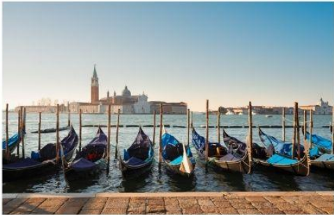
เรือกอนโดล่า

นำท่านออกเดินทางสู่ ท่าเรือตรอนเคโต เพื่อเตรียมตัวนั่งเรือข้ามสู่เกาะเวนิส เกาะเวนิสเป็นดินแดนแสนโรแมนติก เป็นเมืองที่ไม่เหมือนใคร โดยใช้เรือแทนรถ ใช้คลองแทนถนน มีสมญานามว่าเป็น “ราชินีแห่งทะเลเอเดรียติก” มีเกาะน้อยใหญ่กว่า 118 เกาะและมีสะพานเชื่อมถึงกัน กว่า 400 แห่ง