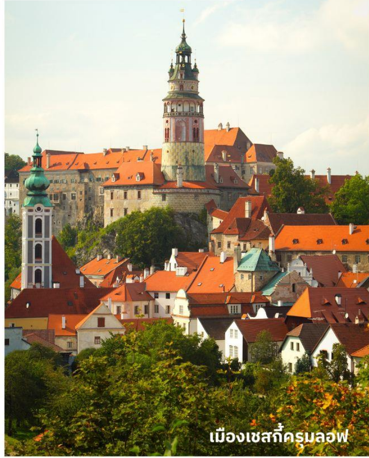
เมืองเชสกีครุมลอฟ

อิสระให้ท่านเดินเที่ยวชมเมืองโบราณตามอัธยาศัย