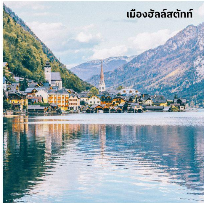
เมืองฮัลล์สตัดท์