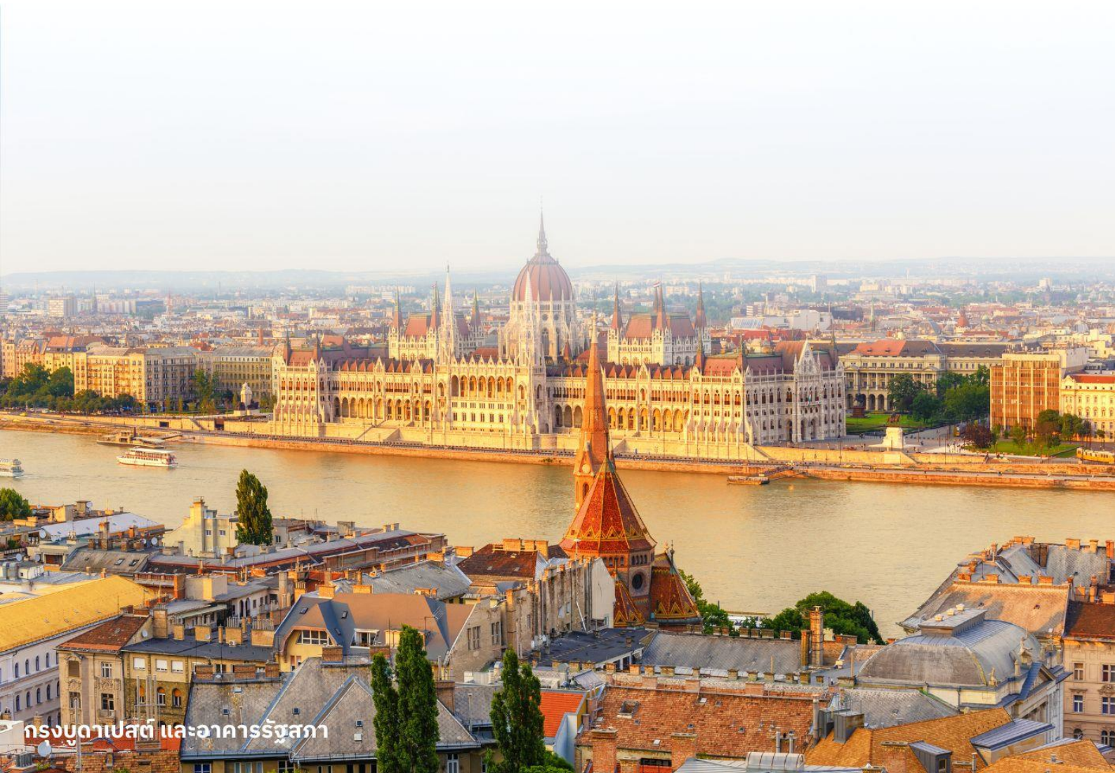
กรุงบูดาเปสต์ และอาคารรัฐสภา

นำท่านเข้าสู่ที่พัก Park Inn By Radisson Budapest หรือเทียบเท่า