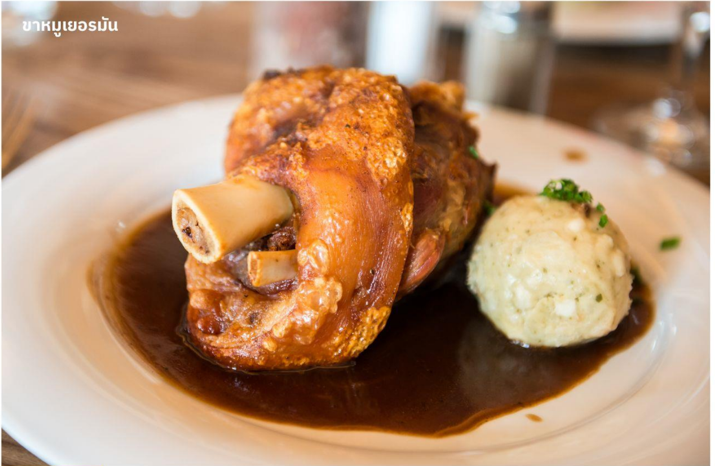
ขาหมูเยอรมัน

บริการอาหารคำ ณ ภัตตาคาร เมนูพิเศษขาหมูเยอรมันต้นตำหรับ+เบียร์เยอรมันต้นตำหรับ นำท่านเข้าสู่ที่พัก Holiday Inn Munich - South หรือเทียบเท่า