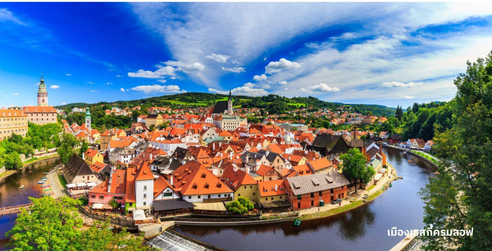
เมืองเชสกีครุมลอฟ

นำท่านเข้าสู่ที่พัก Hotel Bellevue Cesky Krumlov หรือเทียบเท่า