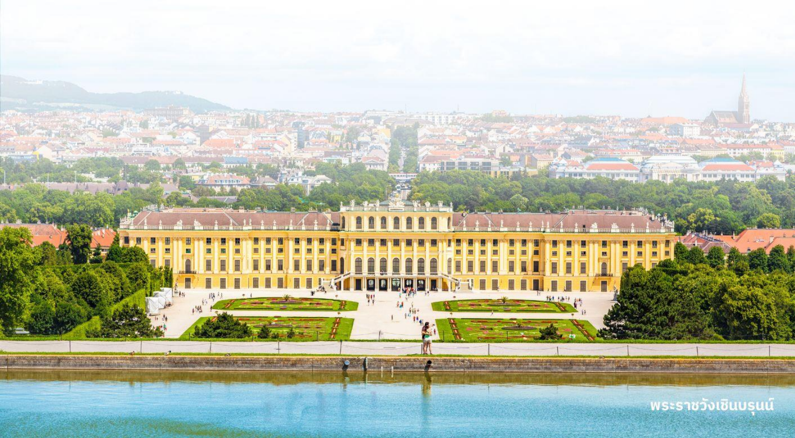
พระราชวังเซินบรุนน์

อิสระอาหารกลางวันตามอัธยาศัย (ท่านสามารถเลือกรับประทานอาหารได้ภายใน OUTLET)