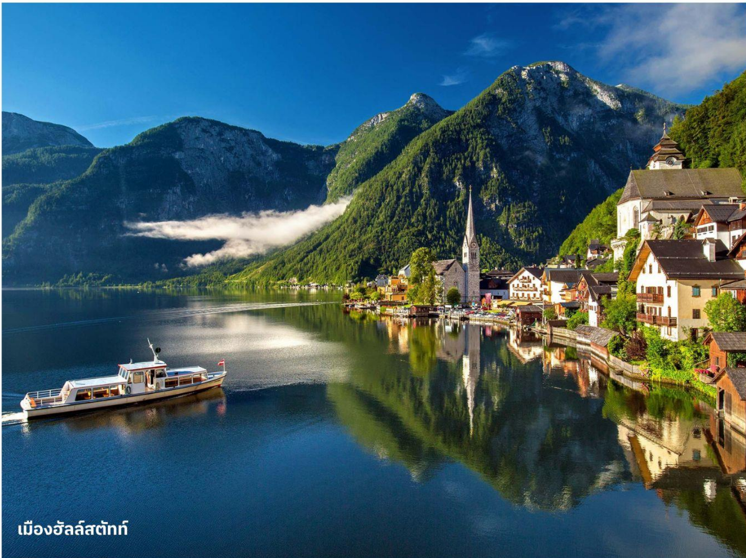
เมืองฮัลล์สตัดท์