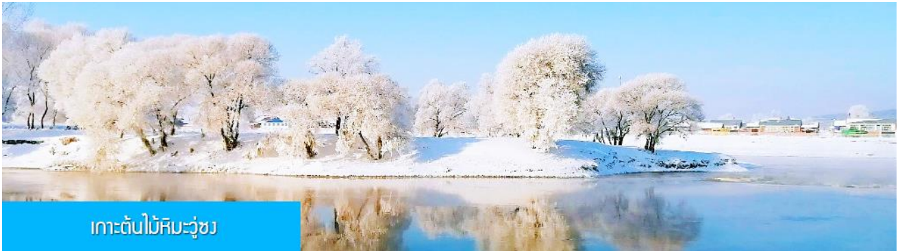
เกาะต้นไม้หิมะวู้ซง

พักที่ RENWICK HOTEL 4* หรือ โรงแรมในระดับเดียวกันในเมืองจีหลิน