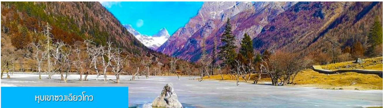
หุบเขาชวงเฉียวโกว

นำท่านเที่ยวชม หุบเขาชวงเฉียวโกว 双桥沟景区 ที่เป็นแหล่งท่องเที่ยวที่สวยงามที่สุดแห่งหนึ่งในเขตอุทยานสี่ครุณี นำท่านนั่งรถบัสของอุทยานที่วิ่งไปผ่านเส้นทางที่สร้างคู่ขนานกับลำธารภายในหุบเขา ท่านจะได้สัมผัสกับความสวยงามของทัศนียภาพธรรมชาติที่หาชมได้ยาก โดยมีภูเขาหิมะสูงตระหง่านอยู่เบื้องหลัง ธารน้ำใสไหลริน และสระน้ำที่มีสีเขียวมรกต ในฤดูใบไม้ผลิและฤดูร้อนท่านจะได้เห็นฝูงจามรีท่ามกลางทุ่งหญ้าเขียวขจี ส่วนในฤดูหนาวทุ่งหญ้าและพื้นดินจะปกคลุมด้วยพรมหิมะสีขาว.. รถบัสของอุทยาน