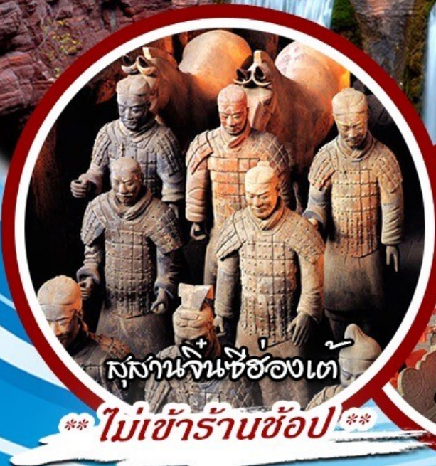
สุสานจักรพรรดิฉินที่หนึ่ง