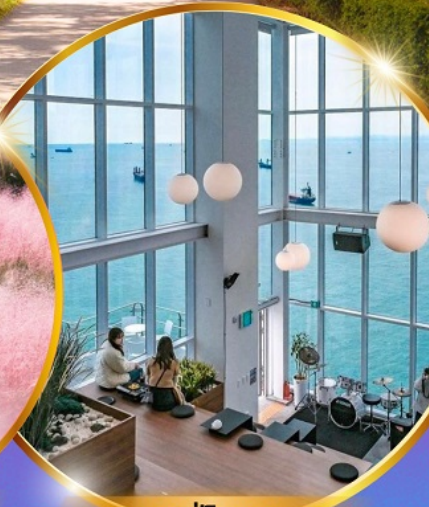
คาเฟ่วิวทะเล

ถ่ายรูปชิคๆ หมู่บ้านวัฒนธรรมคิมซอน ใหม่ล่าสุด คาเฟ่ริมทะเล วิวหลักล้าน ชมอุโมงค์ดินเมเปิ้ล สีส้มแดง ถ่ายรูปกับหลญาสีชมพู สดใส ขึ้นเคเบิลคาร์ ชมทะเลปูซาน ห้ามพลาด!! ตลาดปลาที่ใหญ่ที่สุด ชิมของอร่อยที่ตลาดแฮจุนแด อิสระช้อปปิ้ง Lotte Duty Free