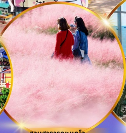
สวนสาธารณะแดโจ