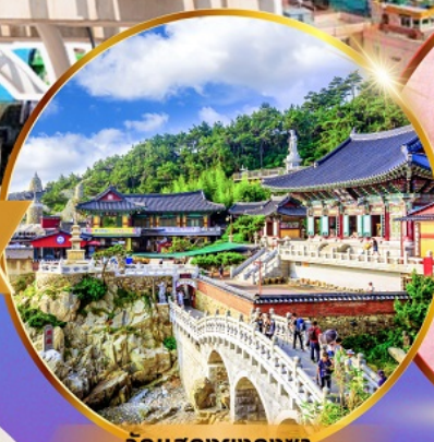
วัดแสงยงกุงซา