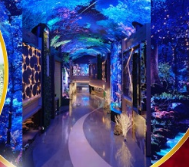
คาเฟ่ดัง Forest Outing