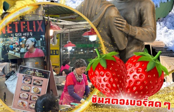
ตลาดกวางจง