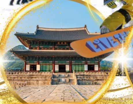
พระราชวังเคียงบกกรุง