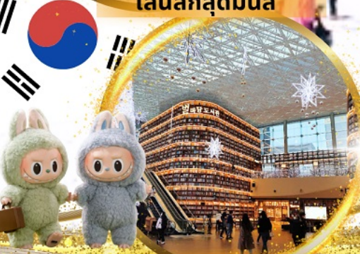
ห้องสมุด Starfield