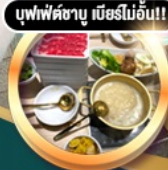
บุฟเฟ่ต์ชาบู เมื่อก่อน!!