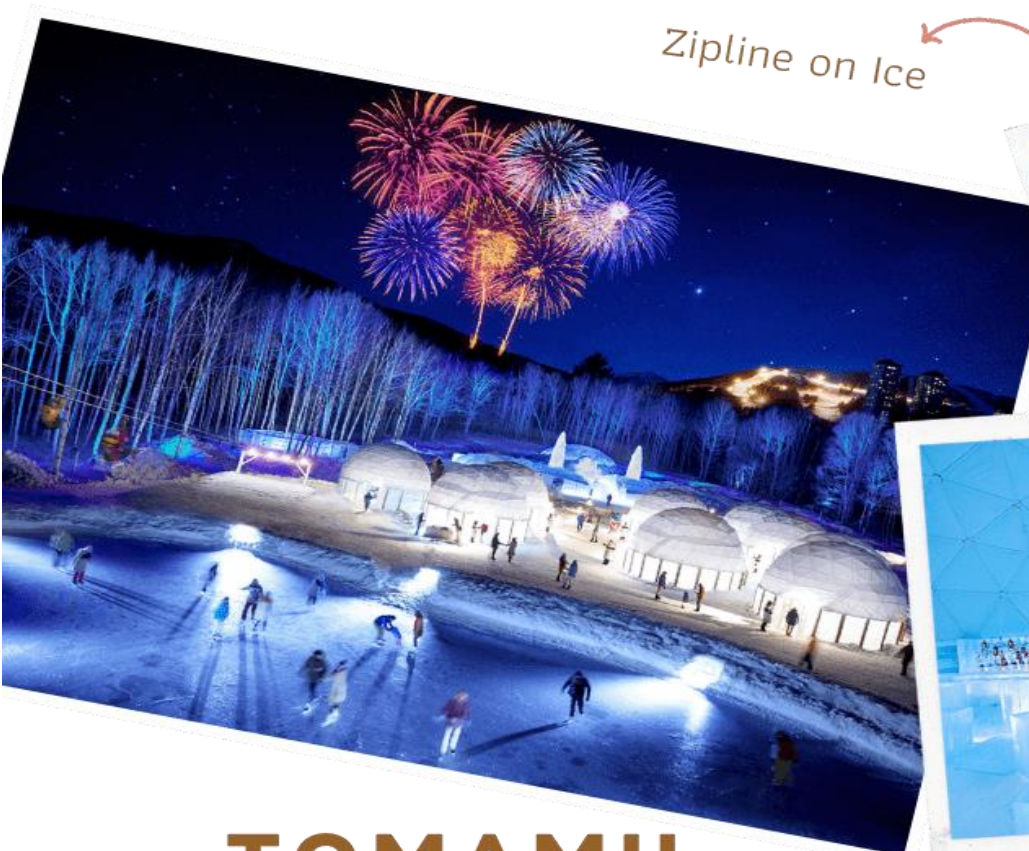
Zipline on Ice

ระยะทางประมาณ 60 เมตร ระหว่างทางคุณจะได้ชื่นชมทิวทัศน์ของหิมะ และลานน้ำแข็งที่น่าอัศจรรย์ Ice Bakery & Cafe คาเฟ่ที่ให้บริการเครื่องดื่มร้อน และขนม ที่ให้ท่านนั่งทานบนโต๊ะและเก้าอี้น้ำแข็ง Ice Bar บาร์ที่บริการเครื่องดื่มประเภทค็อกเทล และเครื่องดื่มแอลกอฮอล์อื่นๆ หลายชนิด ที่เสิร์ฟใน แก้วน้ำแข็งสวยๆ เป็นต้น (**ราคาทัวร์ไม่รวมค่ากิจกรรมและค่าเครื่องดื่ม Ice Bar, Ice Bakery&Cafe**)