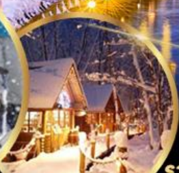
หมู่บ้านเทพนิยาย นิงเกิลเทอเรส