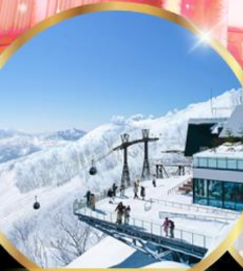
จุดชมวิว Unkai Terrace