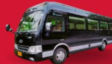
BUS (10-18 ท่าน)