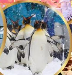
สวนสัตว์ อาซาฮิยาม่า