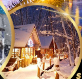
หมู่บ้านเทพนิยาย นิงเกิลเทอเรส