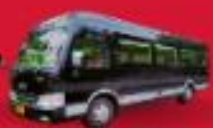
BUS (10-18 ท่าน)