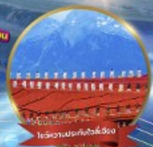
โถงเวลาเมืองลี่เจียง