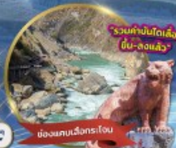
มังกรหยกเสือกะโจน