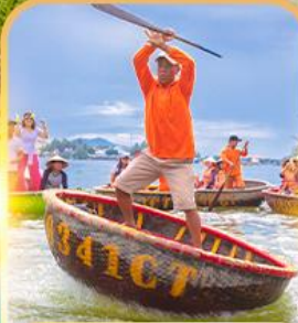
เรือกระด้ง