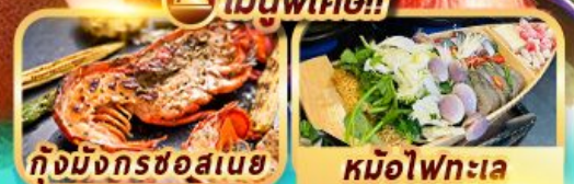
กุ้งมังกรซอสเนย