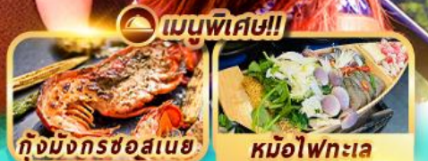
เมนูพิเศษ!!