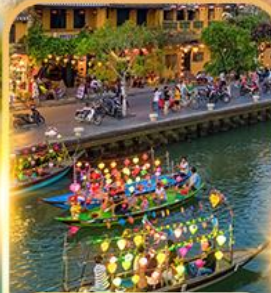
ล่องเรือลอยกระทง