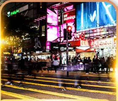
ซ้อปบั้ง Tsim Sha Tsui