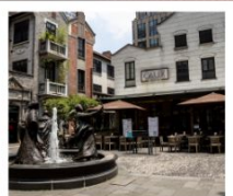
ซินเทียนตี้