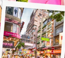
ช้อปปิ้งย่านมงก๊ก