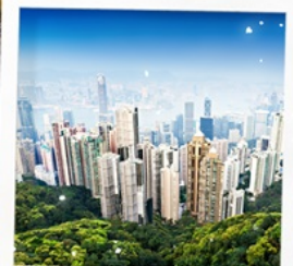
จุดชมวิวกาฬาคตอเรีย