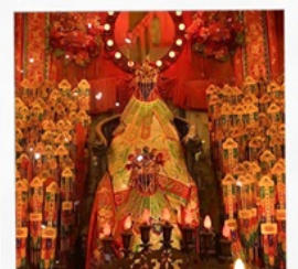
เจ้าแม่กวนอิมวัดสองฮา