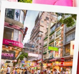
ช้อปปิ้งย่านมงก๊ก