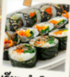
เรียนทำคิมบัม