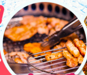
หมูย่างเกาหลี