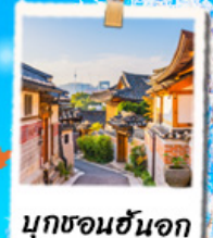
มุกชอนฮันจอก