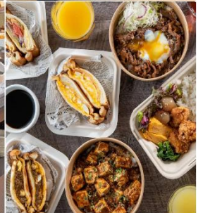
Hotel Flexstay Hakodate Ekimae