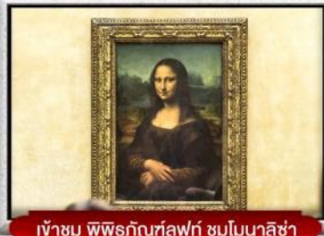
เข้าชม พิพิธภัณฑ์ลูฟวร์ ชมโมนาลิซ่า