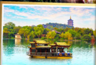
ล่องเรือทะเลสาปซีหู