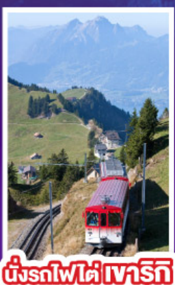
นั่งรถไฟใต้เขาริกิ