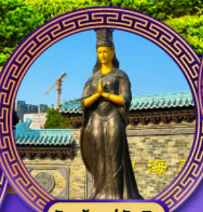
วัดเจ้าแม่ทับทิม