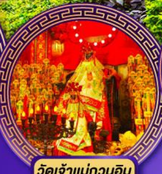
วัดเจ้าแม่กวนอิม ฮ่องฮ่า