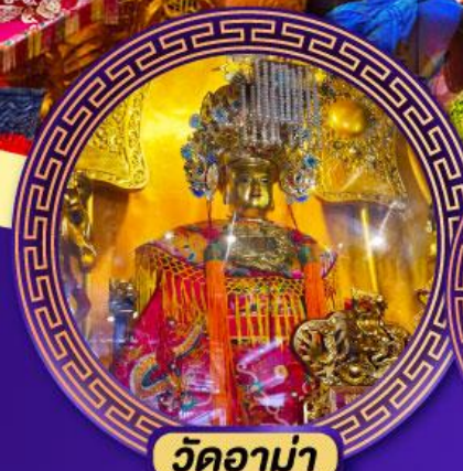
วัดอาม่า