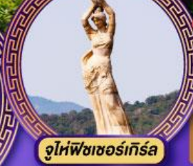
จูไห่พิชชอร์เทิล