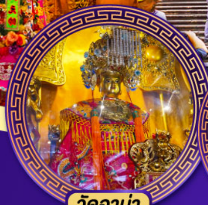
วัดอาม่า