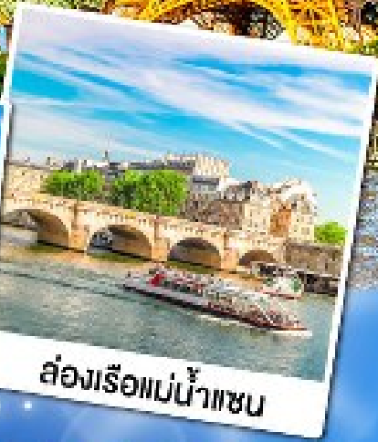
ส่องเรือแม่น้ำแซน