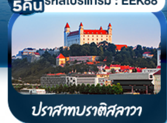
ปราสาทบราติสลาวา