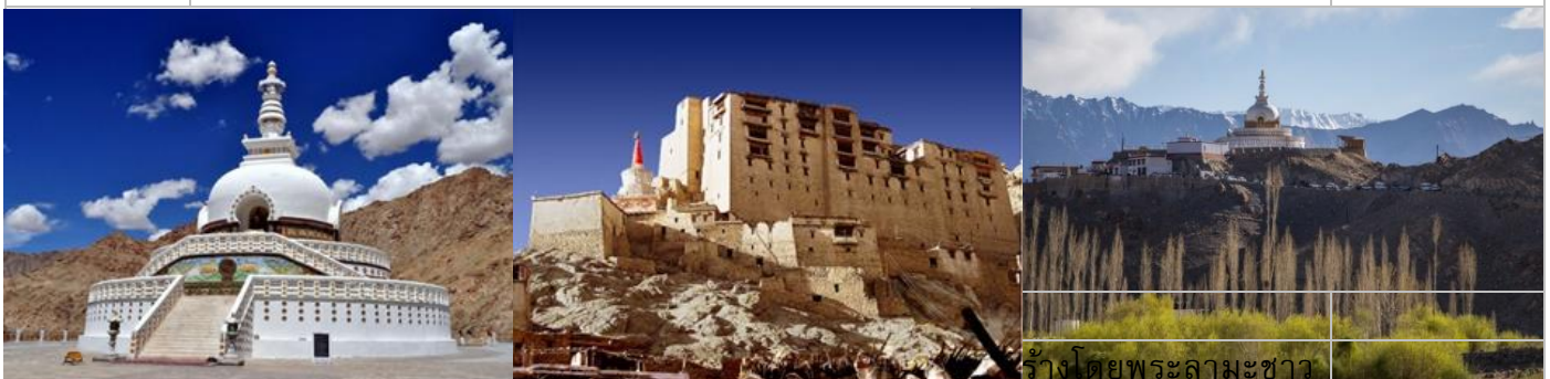
ภูปูน เป็นจุดชมวิวที่สามารถเห็นตัวเมืองเลห์ และพระราชวังเลห์ได้อย่างชัดเจน