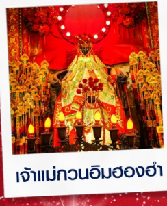
เจ้าแม่กวนอิมสองฮ่า