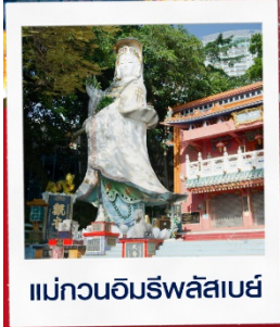
แม่กวนอิมรพลัสเบย์