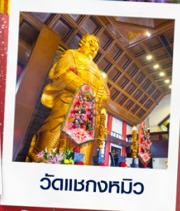
วัดแซกกงหมิว