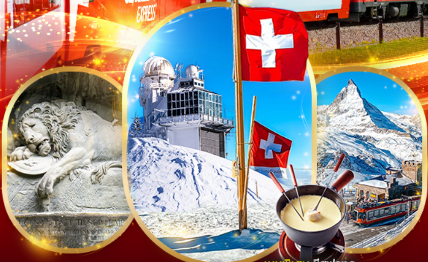
เมนูพิเศษ ชีสฟองดู