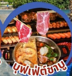
บุฟเฟ่ต์ชาบู