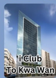
i Club To Kwa Wan

คอนเฟิร์มเดินทาง พฤษภาคม 2567 2-4 / 9-11 / 16-18 23-25 / 30 พ.ย. - 2 ธ.ค.