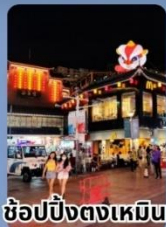
ช้อปปิ้งตงเหมิน