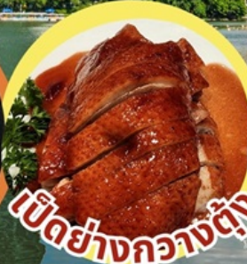
เป็ดย่างกวางตุ้ง