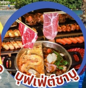
บุฟเฟต์ซาบู