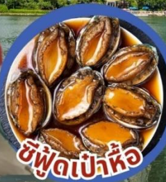
ซีฟู้ดเป่าหื้อ