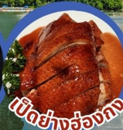
เป็ดย่างฮ่องกง