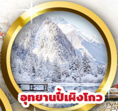
อุทยานปี้เฟิงโกว