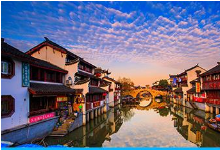
เมืองโบราณ ซิเป่า