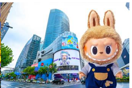
ร้าน POP MART