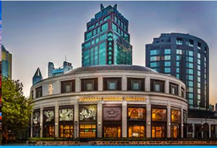
สตาร์บัคใหญ่ที่สุดในโลก