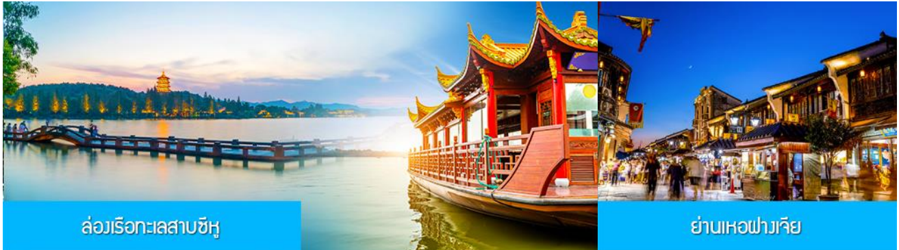
ล่องเรือทะเลสาบซีหู

23.30 น. คณะพร้อมกัน ณ ทำอากาศยานสุวรรณภูมิ อาคารผู้โดยสารระหว่างประเทศขาออก ชั้น 4 ประตู 10 เคาน์เตอร์สายการบิน CHINA EASTERN AIRLINES พบเจ้าหน้าที่บริษัทฯ คอยให้การต้อนรับและอำนวยความสะดวกด้านเอกสารและสัมภาระก่อนการเดินทาง