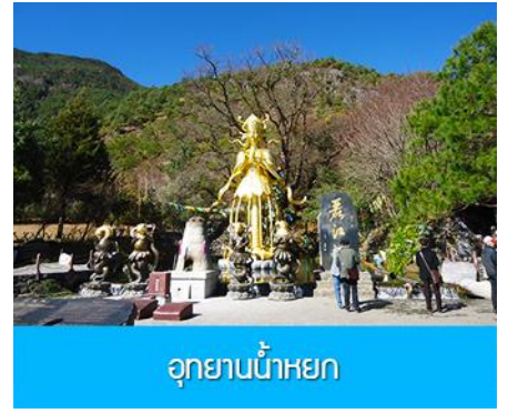
อุทยานน้ำหยก

วันที่ 1 ภูเขาหิมะมังกรหยก (รวมนั่งกระเช้าใหญ่ขึ้นลง)– หุบเขาพระจันทร์สีน้ำเงิน-น้ำตกไปสู่ยเหอ ออฟชั่น ไกด์ขายรถออล์ฟ ท่านละ 80 หยวน โชว์ IMPRESSION LIJIANG- อุทยานน้ำหยก -ต้าหลี่