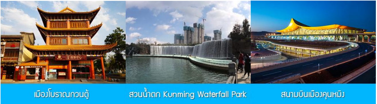
เมืองโบลานกวนตุ๋

พักที่ FEI LONG HOTEL ระดับ 4 ดาว หรือเทียบเท่าในเมืองต้าหลี่