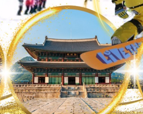
พระราชวังเคียงบกกรุง