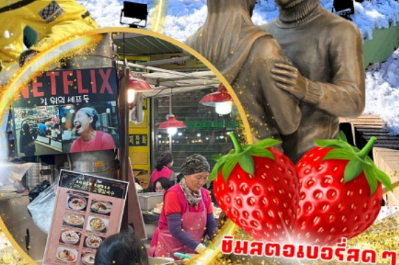
ตลาดกวางจง