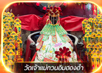
วัดเจ้าแม่กวนอิมของฮ่า