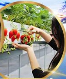
บุฟเฟต์ สดอเบอร์รี่