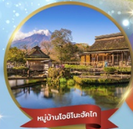
หมู่บ้านโอชิโนะอากิโก