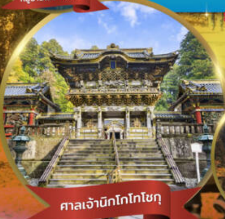
ศาลเจ้ามิกโกโทโซกุ