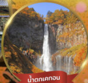
น้ำตกเคคอน