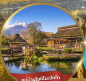
หมู่บ้านโอชิโนะะวิกโก