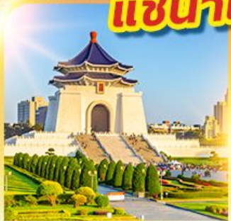
อนุสรณ์เจียงไคเชก

นั่งรถไฟปองปอง! ชมวิวที่ฝิงซาน แช่น้ำแร่ร้อนตัวในห้องพัก