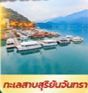
ทะเลสาบสุรียินจันตรา