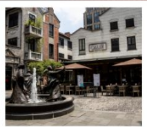
ซินเทียนตี้